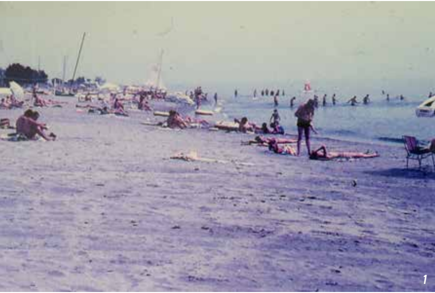
1 La plage du Cap-Sud «originale»