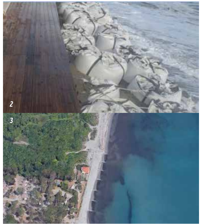
3 Leur effet sur Google Earth